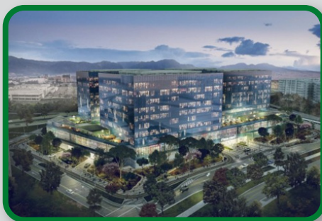
CENTRO MEDICO COLSANITAS SALITRE

Cra. 68 # 24B-10 C.C Plaza Claro Torre 2, piso 4