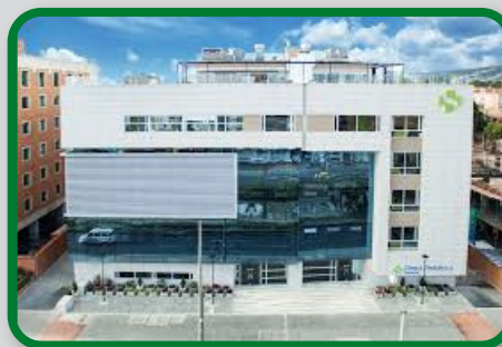
CENTRO MEDICO COLSANITAS LA COLINA

Cra. 68 # 24B-10 C.C Plaza Claro Torre 2, piso 4