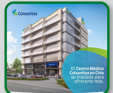
CENTRO EMPRESARIAL AGUA CLARA VIA CHIA- CAJICA