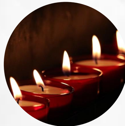
Fallecimiento cónyuge o hijos

Título de pregrado para el asegurado o hijos menores de 25 años