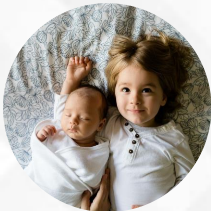
Nacimiento o adopción