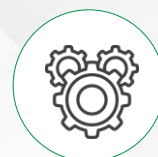
Maquinarias y Equipos