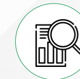
Investigación de siniestros